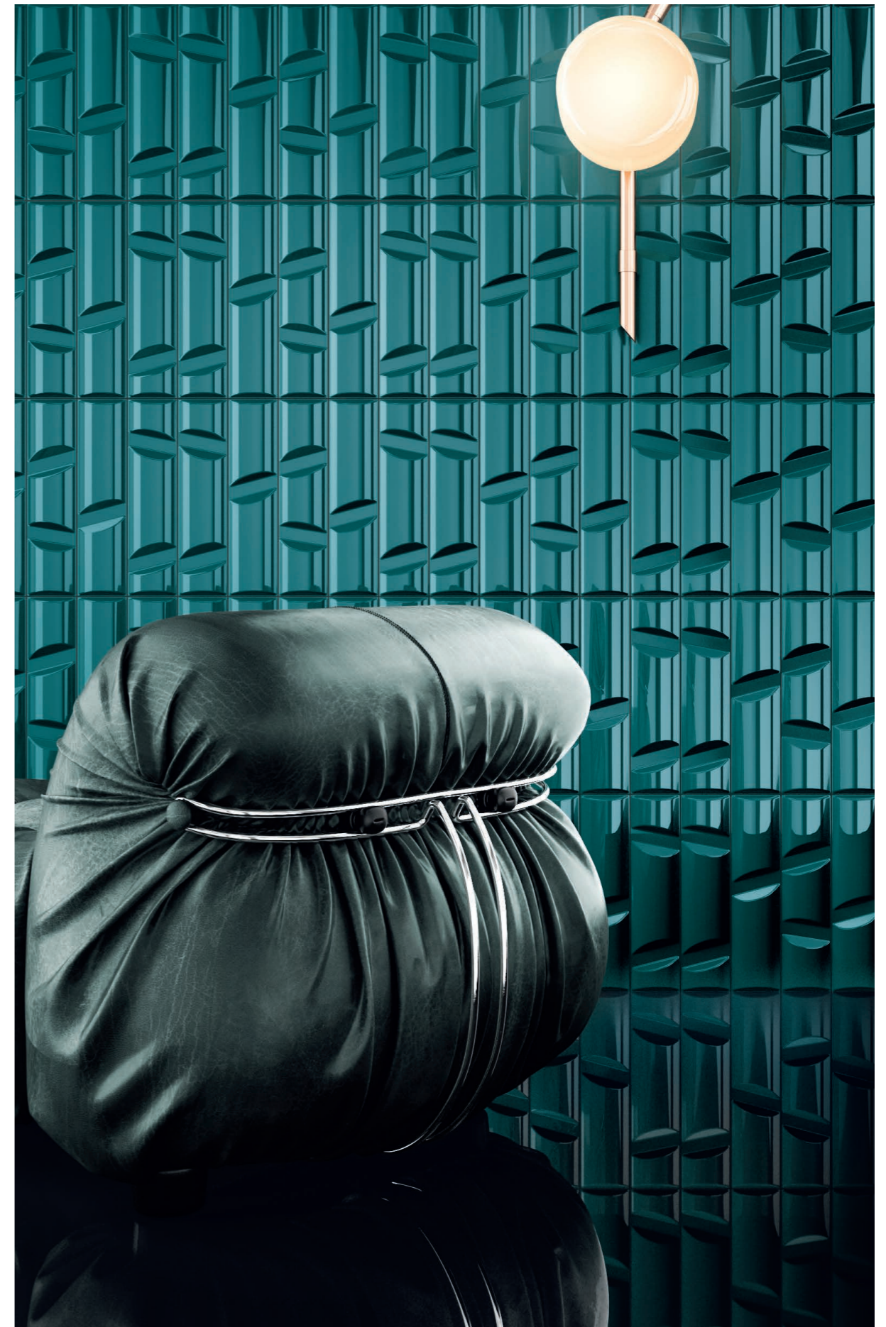
OFFICE , rivestimento / covering VOLUME 4 (cm. 10x40 - 4"x16"), Cromia 4 (cm. 10x40 - 4"x16"). LIVING , rivestimento / covering VOLUME 12 (cm. 10x40 - 4"x16").