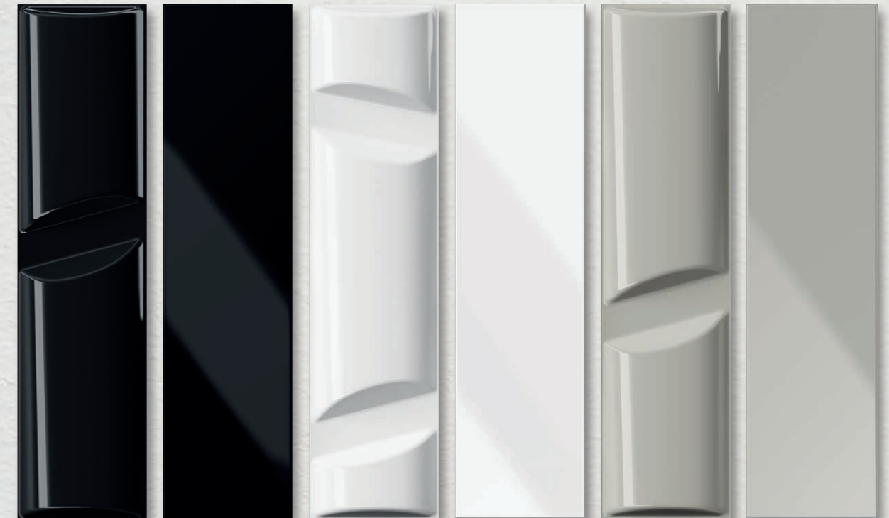
VOLUME 1 CROMIA 1 VOLUME 2 CROMIA 2 VOLUME 4 CROMIA 4