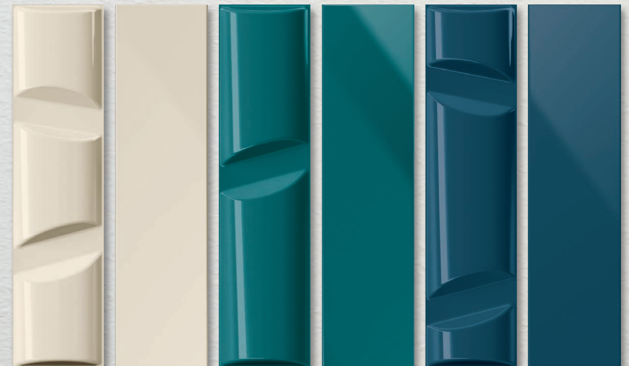
VOLUME 5 CROMIA 5 VOLUME 12 CROMIA 12 VOLUME 14 CROMIA 14

BAGNO / BATHROOM , rivestimento / covering VOLUME 2 (cm. 10x40 - 4"x16"), Cromia 2 (cm. 10x40 - 4"x16"). Pavimento/Flooring Cromia 2 (cm. 10x40 - 4"x16").