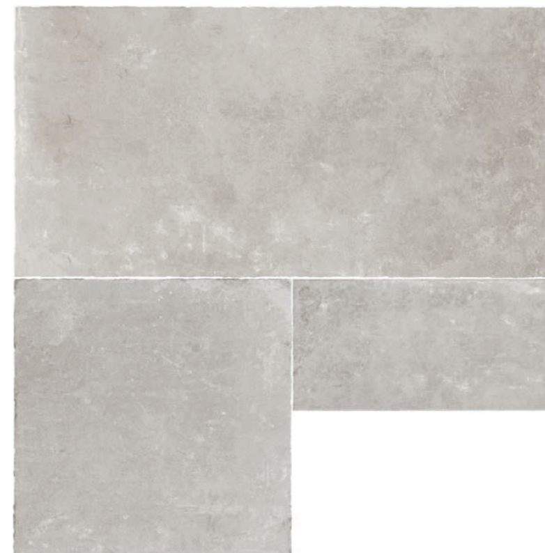
R7KU PietrAntica XT20 White Tumbled Edges rettificato * 60x210 (1pz 60x120, 1pz 60x60, 1pz 30x60)