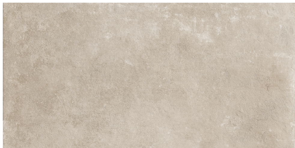
R7KJ PietrAntica XT20 Beige rettificato 60x120