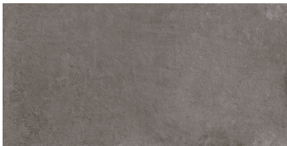
R7KK PietrAntica XT20 Multicolor rettificato 60x120