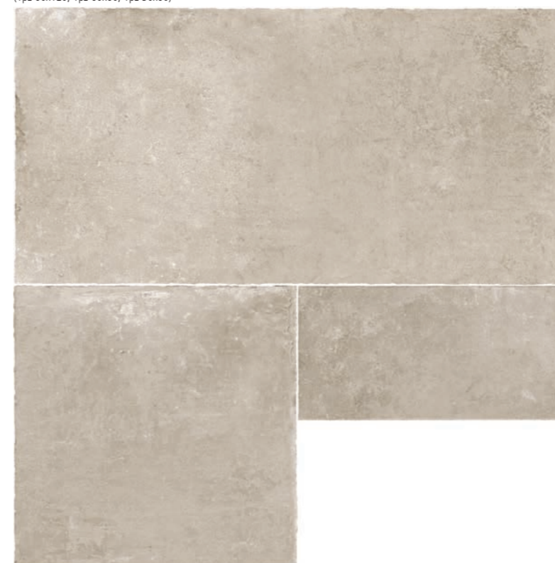
R7KV PietrAntica XT20 Beige Tumbled Edges rettificato * 60x210 (1pz 60x120, 1pz 60x60, 1pz 30x60)