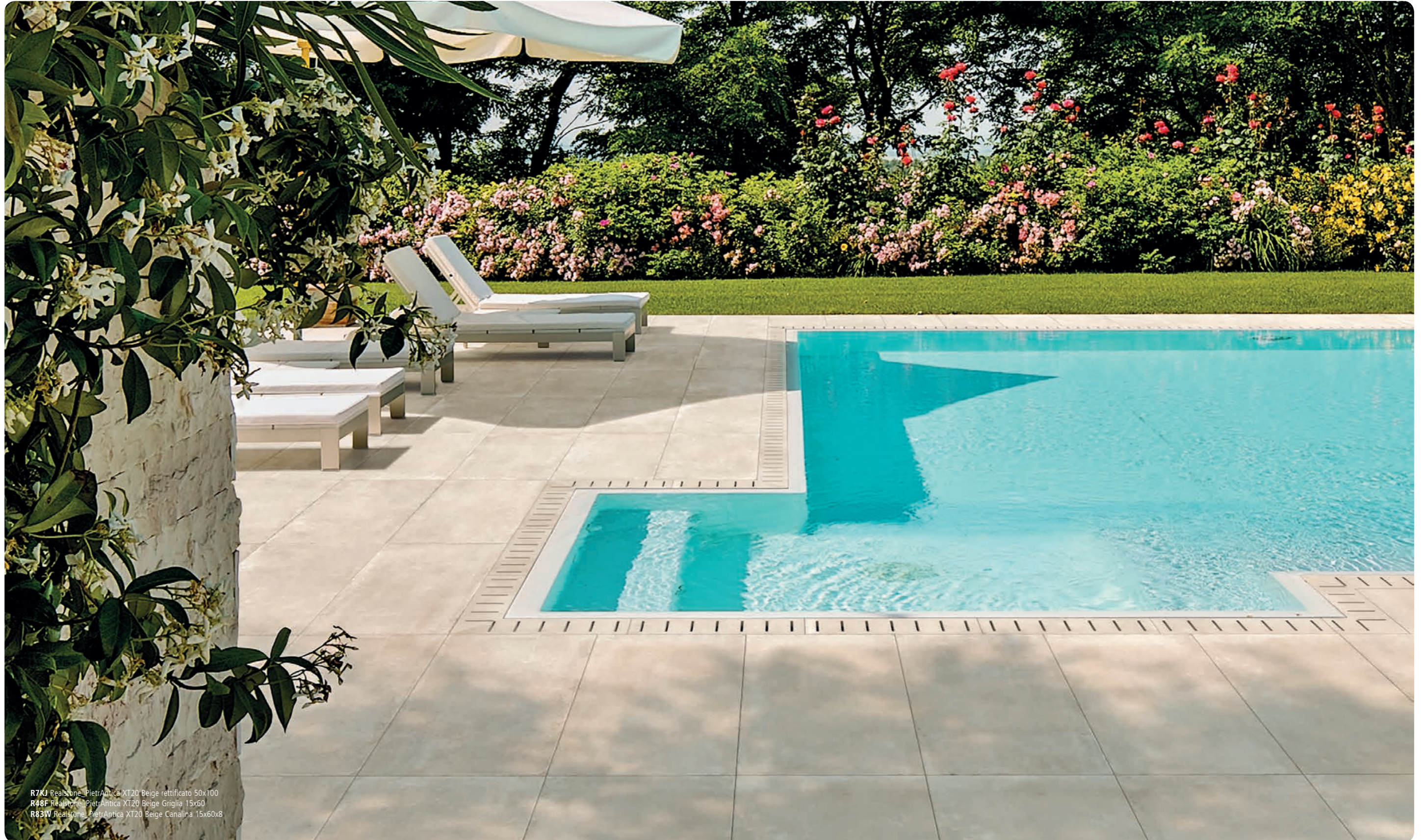
R7KJ Realstone_PietrAntica XT20 Beige rettificato 50x100 R48F Realstone_PietrAntica XT20 Beige Griglia 15x60 R83W Realstone_PietrAntica XT20 Beige Canalina 15x60x8