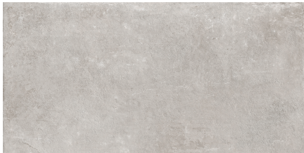
R7KG PietrAntica XT20 White rettificato 60x120

superfici / surfaces / finitions / oberflächen / superficies / поверхности: outdoor